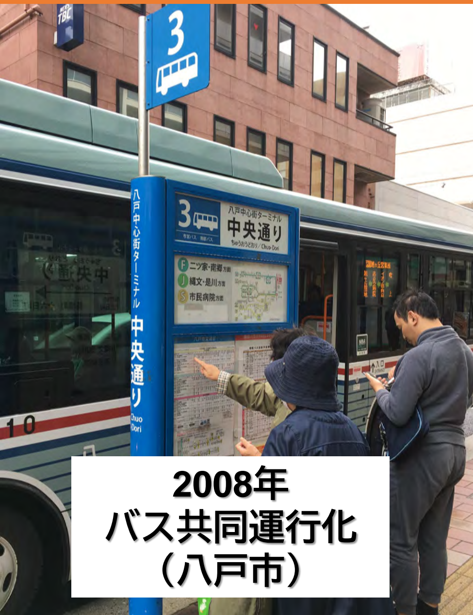
2008年 バス共同運行化 (八戸市)