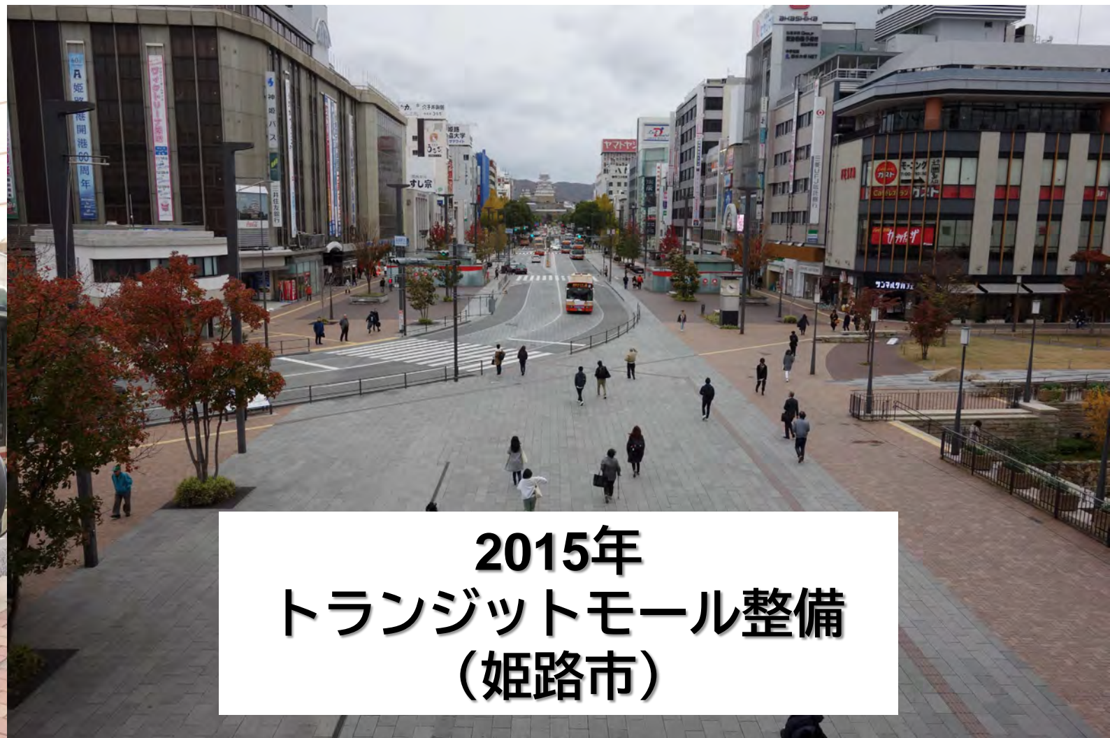
2015年 トランジットモール整備 (姫路市)