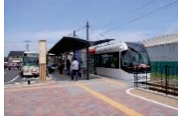
バスとLRTとのスムーズな乗換環境