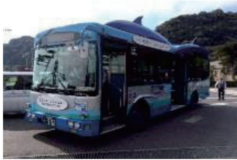
観光地を巡る循環バス