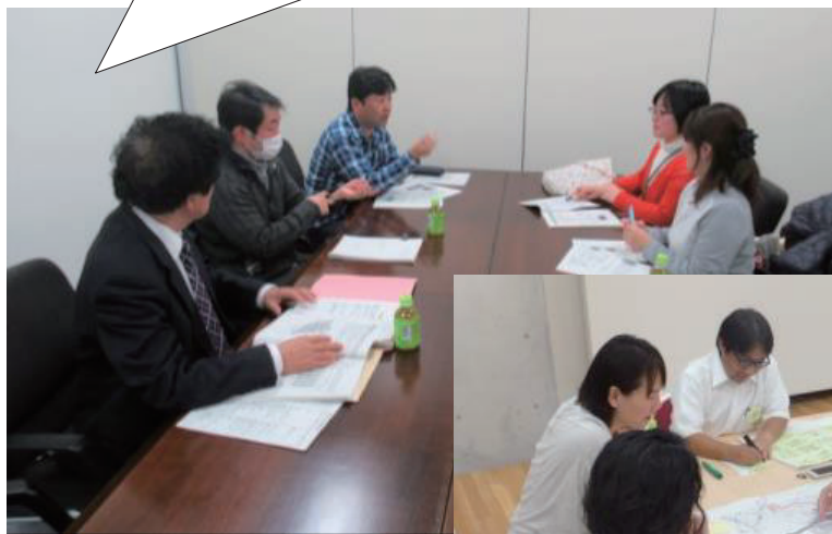
地域公共交通会議の住民委員

★ 私たちが考えたかわみんタク シー！自分たちで考えてもっと 良い乗り物にしよう！ ★