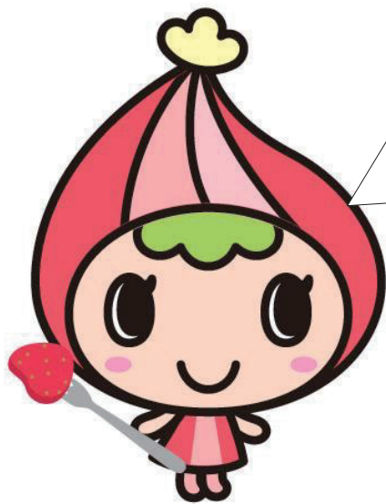
川島町マスコットキャラクター かわみん